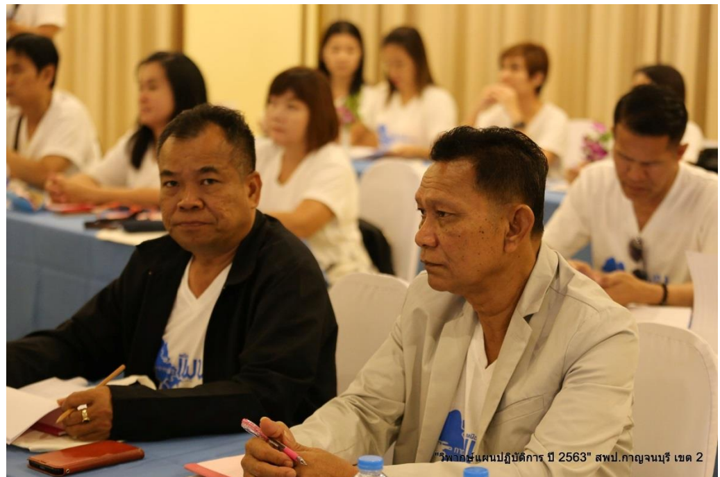
"วิพากษ์แผนปฏิบัติการ ปี 2563" สพป.กาญจนบุรี เขต 2