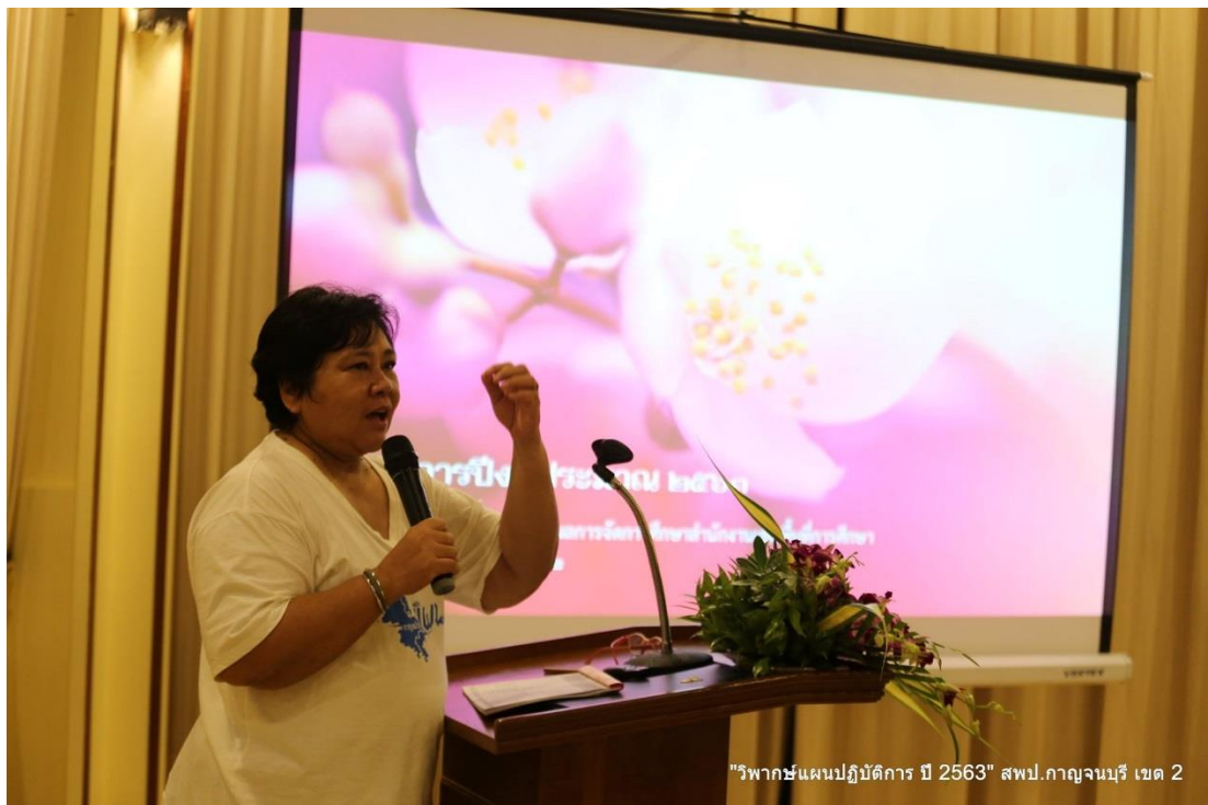
"วิพากษ์แผนปฏิบัติการ ปี 2563" สพป.กาญจนบุรี เขต 2