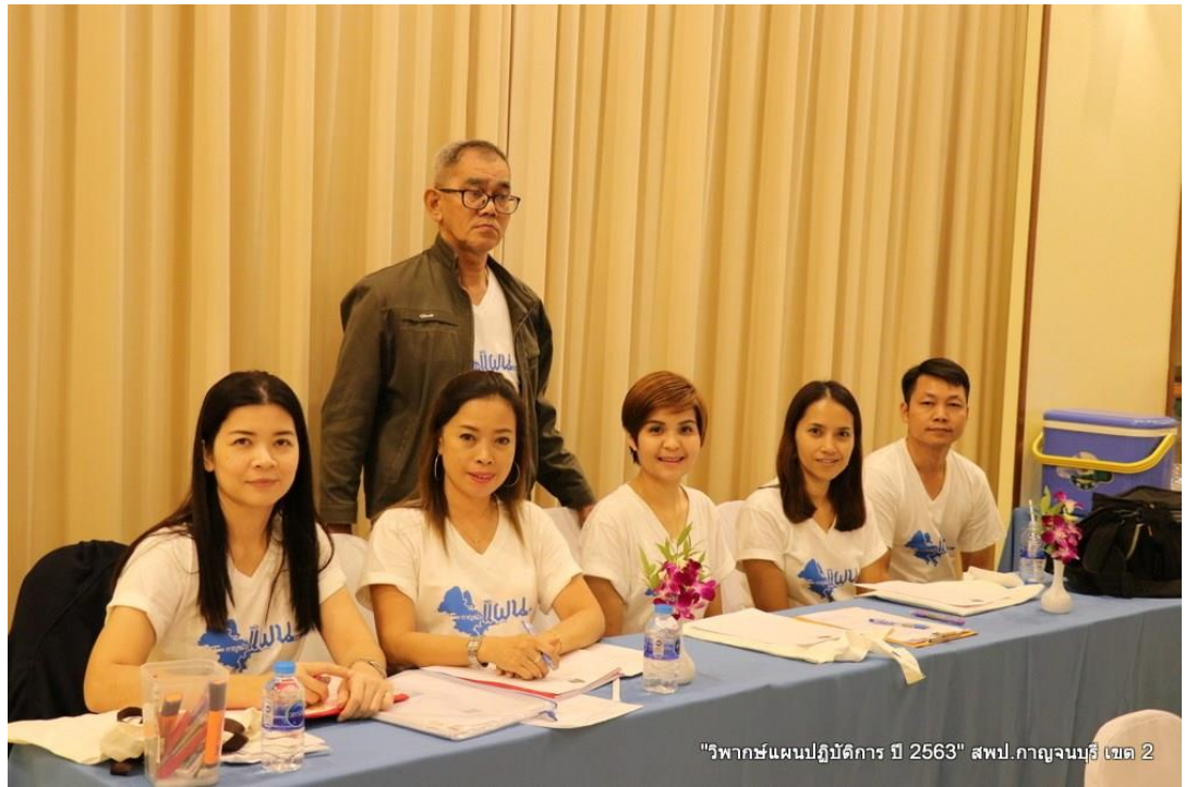
"วิพากษ์แผนปฏิบัติการ ปี 2563" สพป.กาญจนบุรี เขต 2