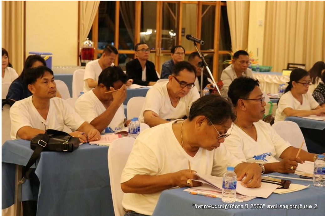
"วิพากษ์แผนปฏิบัติการ ปี 2563" สพป.กาญจนบุรี เขต 2