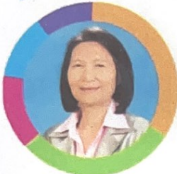
ศ.ดร.สุมาลี สิงขันธ์