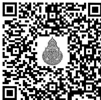
แนวทางการใช้วิดิทัศน์โครงการ Meditation CFH