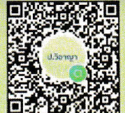
สแกน เพื่อเข้าร่วม Line Open Chat