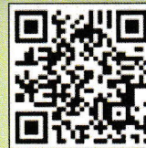
สแกน เพื่อลงทะเบียน

ค่าลงทะเบียนในการฝึกอบรม 10,000 บาท (ไม่รวมค่าอาหาร ค่าที่พัก และค่าเดินทาง)