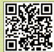
สแกน รายละเอียดโครงการ