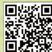
สแกน ใบสมัครฉบับเต็ม