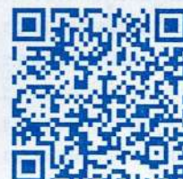
QR Code รายงานผลการดำเนินงาน ทุนการศึกษา ๖๐ ปีครองราชย์